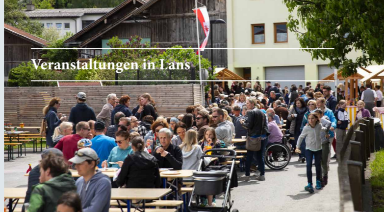
Veranstaltungen in Lans

Bewerbungen bitte an: gemeinde@gemeinde-lans.at .